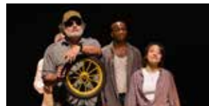
Braconniers 1 er et 2 février (p.53)