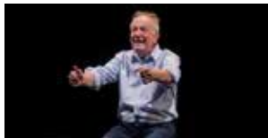
Parle, envoie-toi ! 20 et 21 novembre (p.33)