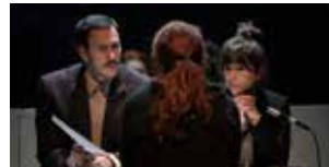
Denali Du 9 au 11 nov. (p.27)