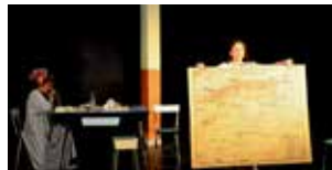
L'Art de perdre 28 et 29 novembre (p.35)