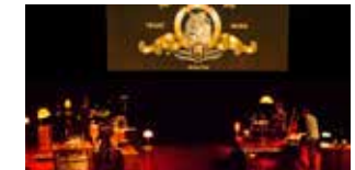
Blockbuster 1 er et 2 mars (voir p.57)