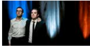
Le Prix de l'ascension 12 et 13 octobre (p.21)