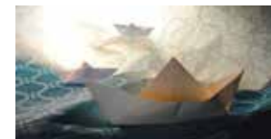
Un océan d'amour 7 décembre (p.39)