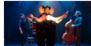
La Truite 28 et 29 septembre (p.13)