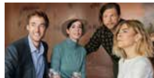
Dabadie ou les choses... 26 et 27 avril (p.71)