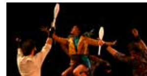
Foutoir céleste Du 15 au 27 nov. (p.29)