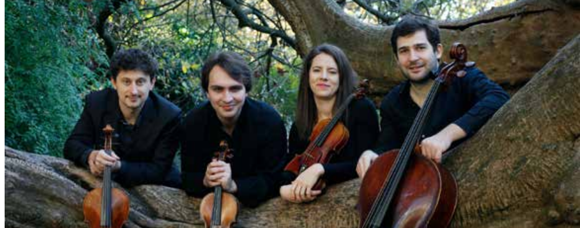
Quatuor Odysée

Programmation complète sur www.mediatheque-carquefou.fr