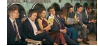
Voces8 15 mai (p.73)