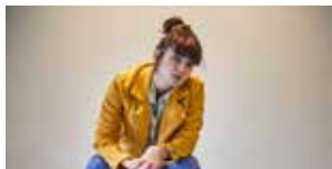
Le Processus Du 7 au 9 janvier (p.45)