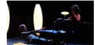
Ovni rêveur 24 avril (p.69)