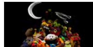
À Moi ! 3 novembre (p.25)