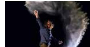
Évidences inconnues 11 et 12 janvier (p.47)