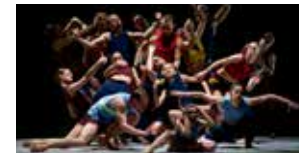
Aterballetto 3 avril (p.67)