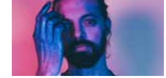
Vaslo 16 janvier (p.49)