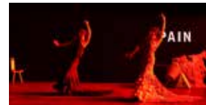
Thisispain 6 février (p.55)