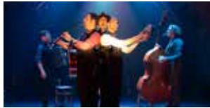
La Truite 28 et 29 septembre (p.13)