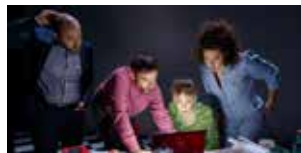
Grand pays 24 et 25 janvier (p.51)