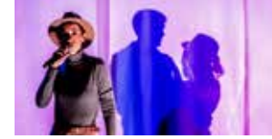
Dabadie ou les choses... 26 et 27 avril (p.71)