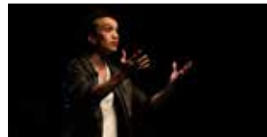
Un garçon d'Italie 2 et 3 décembre (p.37)