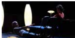
Ovni rêveur 24 avril (p.69)