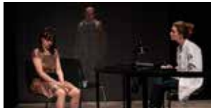
Le Jour où j'ai compris... 5 et 6 octobre (p.17)