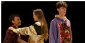
Personne n'est... 29 au 31 mars (p.65)