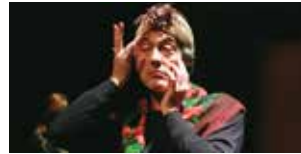
Les Garçons et Guillaume à table Du 8 au 10 mars (p.59)